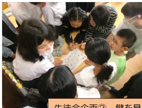
生徒会企画② 鍵を見つけろ謎解きゲーム