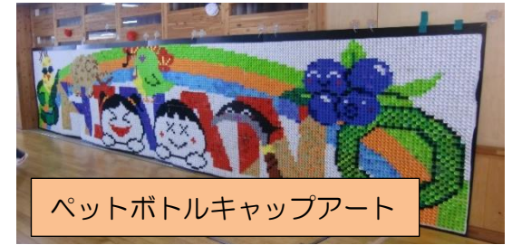
ペットボトルキャップアート