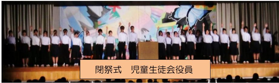
閉祭式 児童生徒会役員