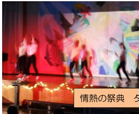
情熱の祭典 ダンス