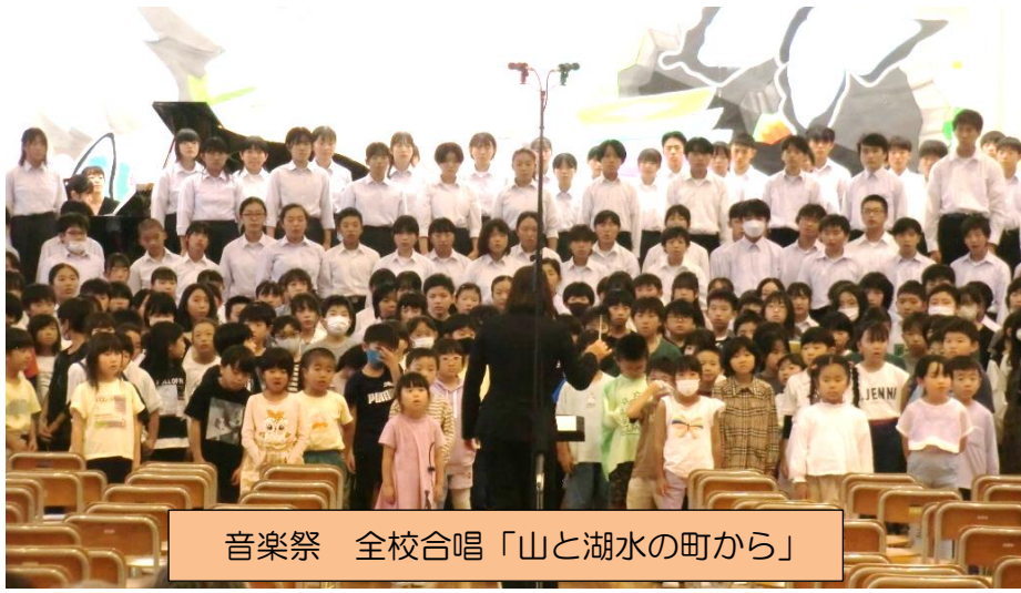
音楽祭 全校合唱「山と湖水の町から」