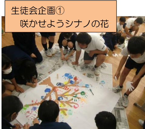
生徒会企画① 咲かせようシナノの花