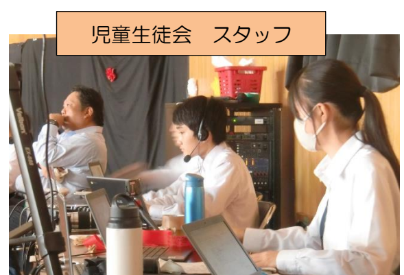
児童生徒会 スタッフ