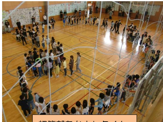
初等部なかよしタイム