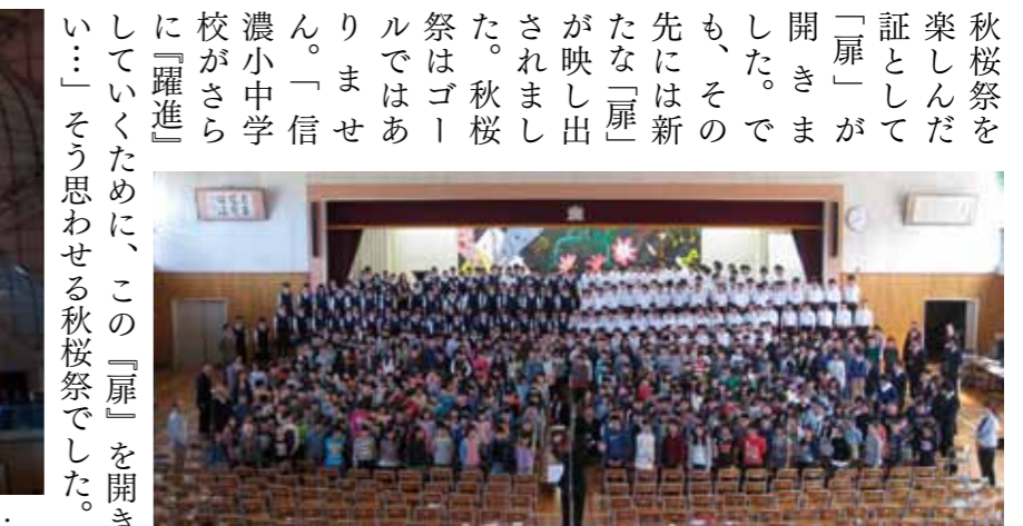
全校合唱「山と湖水の町から」