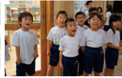
「本気のあいさつ」で学校が明るくなりました

扉！今、本気でやることは何だ!? 9年生にとっては秋桜祭当日に至るまで悩みに悩んだ日々でした。6年生で児童会の運営を経験しなかった9年生。委員会の運営や、企画の計画をするのは初めての経験です。「初等部も高等部も一緒になって楽しめる秋桜祭ってどうすればいいんだろう…」とどり着いた答えは、「本気になつて取り組むことの楽しさを後ろ姿で見せたい」というものでした。2学期に入り、「あいさつ」「回収」「清掃」「大縄」「合唱」に本気にとり組む「本気週間」を企画しました。「ホンキネス認定委員会」と称し、役員が全校の「本気の姿」を写真に撮り、お昼の放送で毎日全校に発信し続けました。何よりうれしかったのは、初等部の子どもたちが一緒になってそれぞれの週