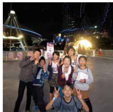
夜の東京ドームシティー