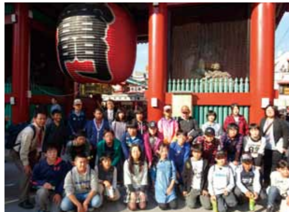
雷門でハイポーズ

なトラブルもなく2日間の旅行を楽しんできました。1日目は、国会議事堂の見学、浅草演芸ホールで寄席体験、東京スカイツリー見学、東京ドームシティアトラクションズでグループ活動と盛りだくさんの日程でした。特に、スカイツリーでは、当日がたまたまキャラクター「ソラカラちゃん」の誕生日で、さらにハロウィンのイベントが行わ