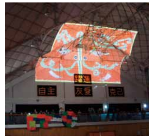
体育館の天井に映し出された新たな扉…全校の本気の力で開いていこう!

間にも本気で取り組んでくれたことです。「初等部の本気に負けるもんか」と高等部も本気になりました。秋桜祭当日、姉妹学校でペアに地よい光が差し込み、空には虹がかかりました。笑顔あふれる吹奏楽部の発表、お兄さんお姉さんにも楽しめるお店がたくさんが得意な人も、苦手な人もみんなで支え合って跳んだ「八の字大縄」、聞いている人を感動させたいと、クラス・学年で創り上げた「合唱」…。この日に向けた本気の積み重ねがあったからこそ、感動を分かち合うことができました。閉祭式。