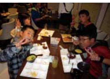
たくさん食べるぞ!

とができました。修学旅行を通して、当日までに準備を行い、当日の係活動も自分から気づいて行動する姿がたくさんありました。当日の班活動では、普段あまり話さない友だちと話をしたり、友だちの意外な一面もたくさん発見したりしました。5ヶ月後には7年生へと進級していきませんが、その前に小学校生活のすてきな思い出がたくさんできました。最後に、この修学旅行に当たり、保護者の皆様や地域の皆様のご支援、ご協力に心より感謝申し上げます。ありがとうございました。