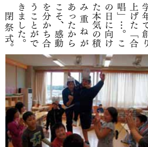
初等部のみんなが一生懸命用意してくれたから楽しいよ!

「ト」と合言葉を言って記念のシールをもらった人もいました。その後東京ドームシティアトラクションズでは、グループごとに時間一杯アトラクションを楽しみました。ジェットコースターに初めて乗った人もいて盛り上がっていました。