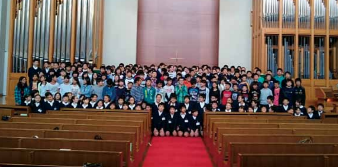
青山学院初等部のみなさんと一緒に

絆と笑顔あふれる修学旅行 信濃小中学校6学年は、10月28日・29日の2日間、東京へ修学旅行に行ってきました。修学旅行テーマ「絆と笑顔あふれる修学旅行」を胸に、全員が楽しめる修学旅行を目指して東京に出発しました。当日は、誰一人欠席することなく、また途中大き