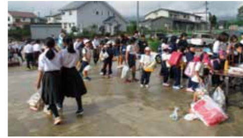
「本気の回収WEEK」では新聞や空き缶を持った子どもたちが、昇降口に大行列!

絆と笑顔あふれる修学旅行 信濃小中学校6学年は、10月28日・29日の2日間、東京へ修学旅行に行ってきました。修学旅行テーマ「絆と笑顔あふれる修学旅行」を胸に、全員が楽しめる修学旅行を目指して東京に出発しました。当日は、誰一人欠席することなく、また途中大き