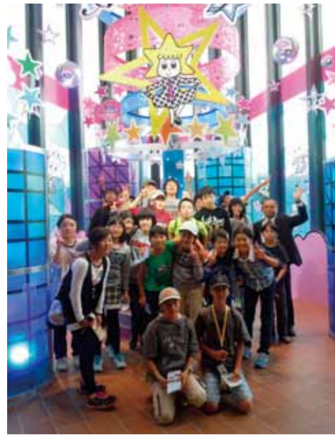
ソラカラちゃんと一緒に記念撮影

扉！今、本気でやることは何だ!? 9年生にとっては秋桜祭当日に至るまで悩みに悩んだ日々でした。6年生で児童会の運営を経験しなかった9年生。委員会の運営や、企画の計画をするのは初めての経験です。「初等部も高等部も一緒になって楽しめる秋桜祭ってどうすればいいんだろう…」とどり着いた答えは、「本気になつて取り組むことの楽しさを後ろ姿で見せたい」というものでした。2学期に入り、「あいさつ」「回収」「清掃」「大縄」「合唱」に本気にとり組む「本気週間」を企画しました。「ホンキネス認定委員会」と称し、役員が全校の「本気の姿」を写真に撮り、お昼の放送で毎日全校に発信し続けました。何よりうれしかったのは、初等部の子どもたちが一緒になってそれぞれの週