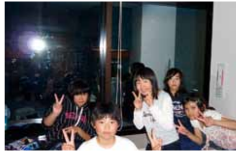
東京の夜景が見える部屋にて

2日目は、青山学院初等部にお招きをいただき交流活動を行いました。初等部生が毎朝行っている「礼拝」を一緒に見学させていただきました。お互いに合唱も披露しあいました。礼拝堂で歌う合唱は少し緊張しましたが、歓迎会のお礼を込めて「地球星歌」を歌うこ