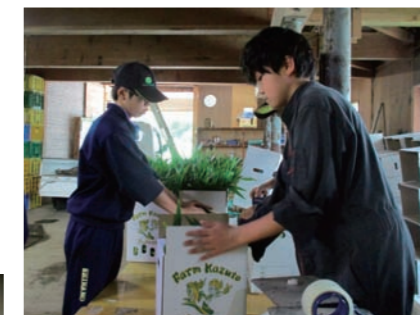
ヤングコーンの箱詰め