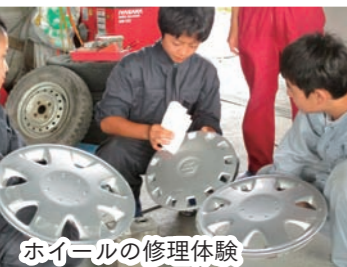
ホイールの修理体験