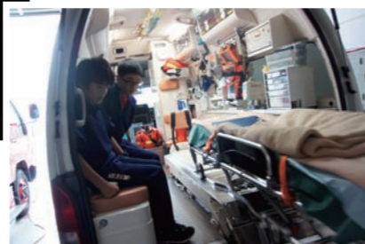
救急車に乗り、説明を聞く