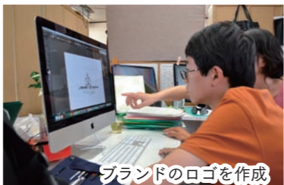
ブランドのロゴを作成