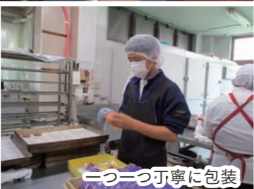
一つ一つ丁寧に包装