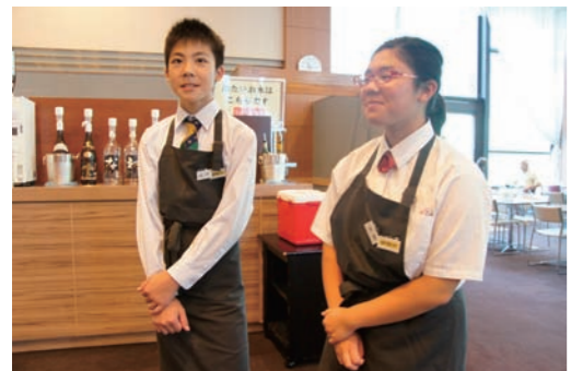
タングラムのレストランでお客様をお出迎え

・今回、職場体験をさせていただいて、朝食営業はずっと立っていて大変だと思いました。しかし、お客様に料理について聞かれたときに、笑顔で答えられたり「ありがとう」と言われたりするのがとても嬉しかったです。スプーンの向きなど、お客様が使う時に使いやすくなるように直すのが、「おもてなしの心」だと思いました。