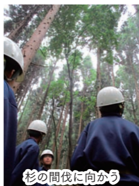
杉の間伐に向かう