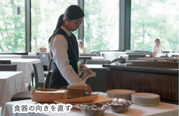
食器の向きを直す