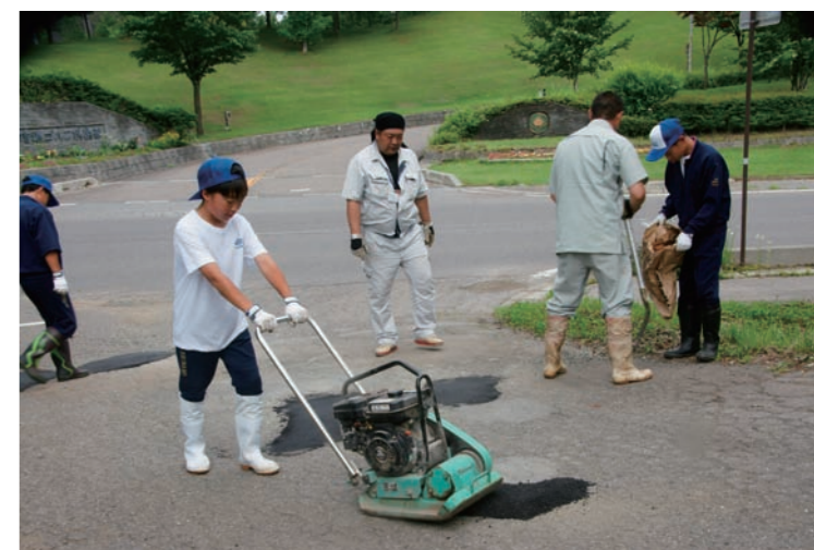
道路の穴を埋めて整備

・今回の職場体験学習では、役場と自分たちとの関係を学びました。いつも道路をさりげなく通っているけど、道路には、たくさんの穴が開いています。その穴を埋めるためには、30kgのレミファルトというものを持っていき、穴に入れて固めなければいけないので、大変でした。信濃町で車が安心して運転できるのは役場の建設水道課のおかげだと思います。大変だったけど、とてもやりがいがあって、楽しく学べました。