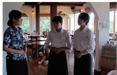
エプロンの締め方、立つ姿勢を教えてください